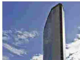
Lombardia, approvata la Legge di Semplificazione 2021