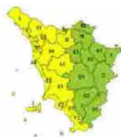
Toscana, codice giallo per mareggiate