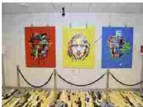
Lombardia, 700Dante: 'tape artist' NO CURVES a Palazzo Pirelli