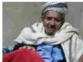
Yemen: Houthi uccidono Imam moschea durante Ramadan