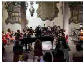
Al via i 'Mercoledì musicali dell'organo e dintorni'