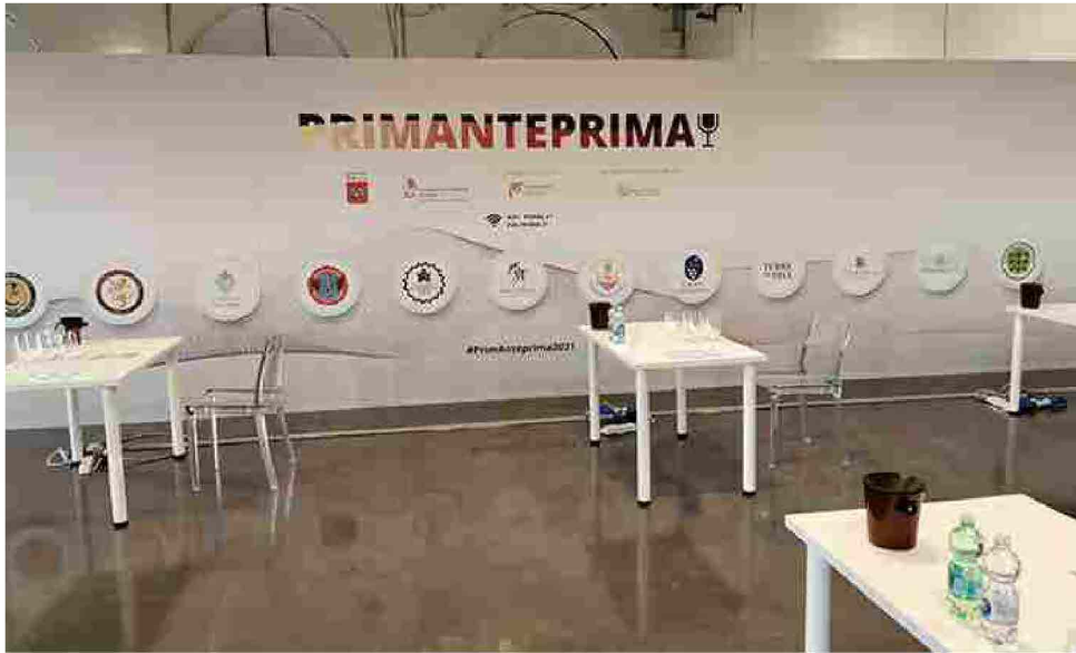
Primanteprima 2021. Tavoli in sicurezza

Consorzio Bianco di Pitigliano e Sovana, Candia dei Colli Apuani, Carmignano, Chianti Rufina, Colline Lucchesi, Cortona, Maremma Toscana, Montecucco, Orcia, Terre di Pisa, Val di Cornia e Suvereto, Valdarno di Sopra. Il loro compito? Far scoprire alla stampa specializzata, nazionale ed estera, le nuove annate e riserve di 170 aziende “tra le più dinamiche e promettenti del panorama regionale” .