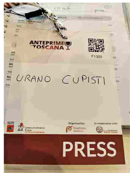
Primanteprima 2021. La mia presenza