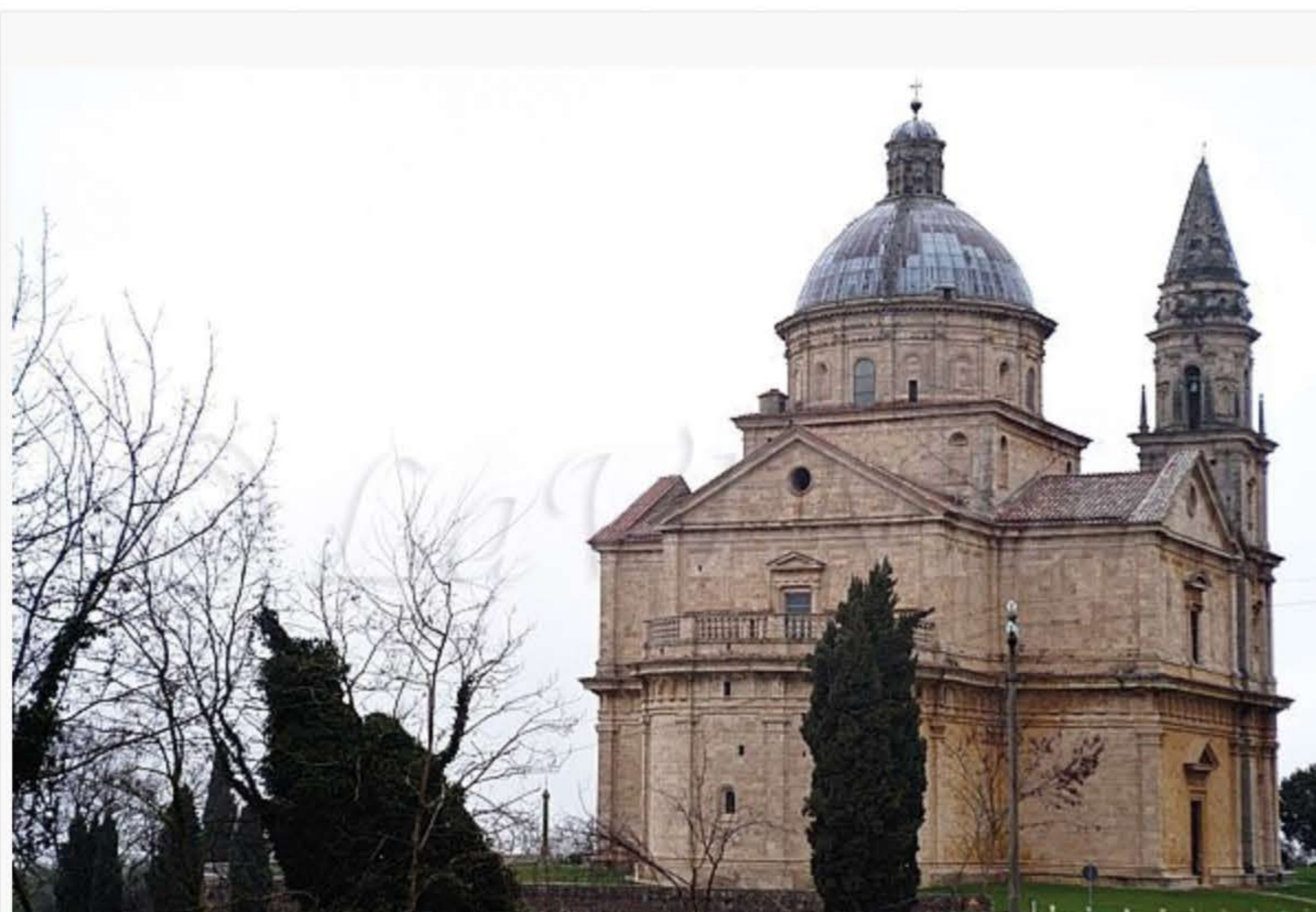
Il Tempio di San Biagio a Montepulciano

Ore 10,30: XIV° degustazione del ciclo "Il Vino Bianco e i suoi Territori" – Sala Dante del Palazzo Comunale, riservata ai giornalisti accreditati.