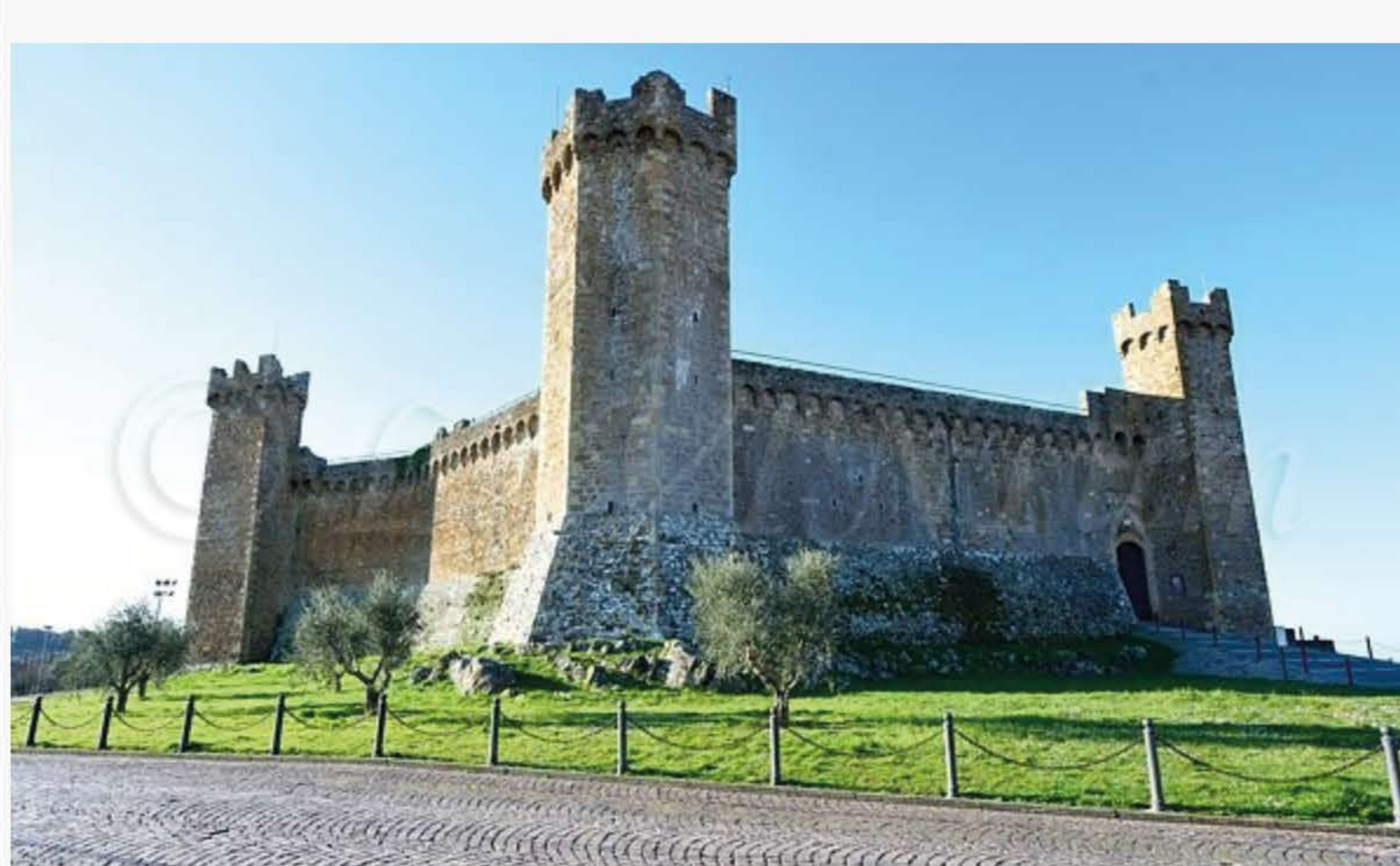
La Fortezza di Montalcino, in passato sede di Benvenuto Brunello

Ingresso riservato solo alla stampa accreditata per la degustazione delle nuove annate di Nobile di Montepulciano, Nobile Selezione e Nobile Riserva.